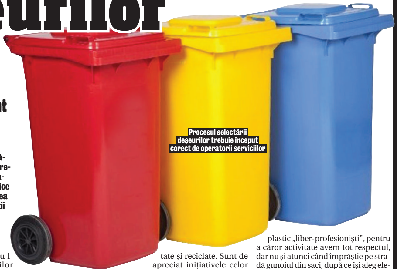
Procesul selectării deșeurilor trebuie început corect de operatorii serviciilor

Totodată, societatea mandatată să strângă deșeurile reciclabile nu se sfiește să colecteze materiale care nu încap în sac (elemente mari din plastic, carton). Un lucru bun. Deci, scoateți corect la poartă ce vă prisosește și veți avea de câștigat. Vom avea cu toții de câștigat. „Sacul Galben” este un început timid, dar promițător. Ar fi și mai promițător dacă lucrătorii care colectează gunoiul reciclabil nu ar arunca saci doar peste gardul celor care au sortat deja gunoiul. Poate unii iau mai târziu hotărârea folosirii corecte a sacilor. Ce fac dacă nu îi primesc? Stimularea acestui demers trebuie să înceapă de sus în jos. Un apel telefonic la societatea Ecovol, biroul din Pantelimon, cu întrebarea: „De ce primesc saci galbeni doar cei care au colectat deja selectiv deșeurile menajere, până acum?”. Răspunsul a fost (cel puțin) surprinzător: „Primesc saci galbeni cei care au colectat. La început, a primit toată lumea”. Deci, ne limităm doar la un grup restrâns de cetățeni pentru această activitate, fără să încercăm să stimulăm o mai mare parte din comunitate? ●